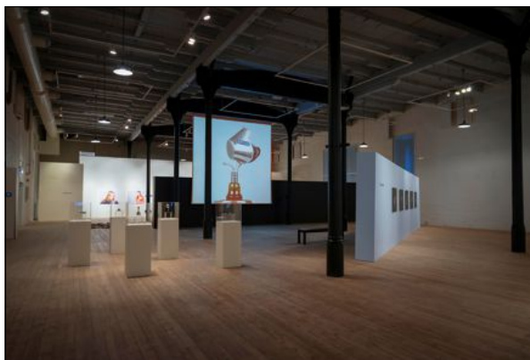
Sokkene på gulvet i utstillingen «Forstørrelser» er strikket av en rumensk kvinne du kan treffe på gaten på Majorstuen i Oslo.